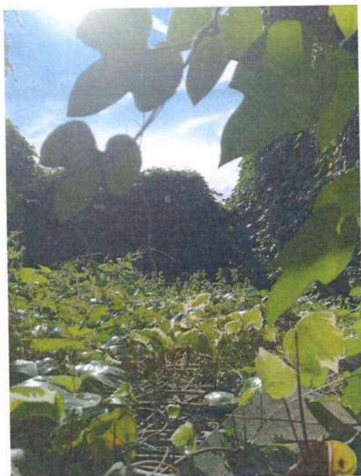
Imagem 3 – Foto da edificação, onde é visível o interior colapsado.