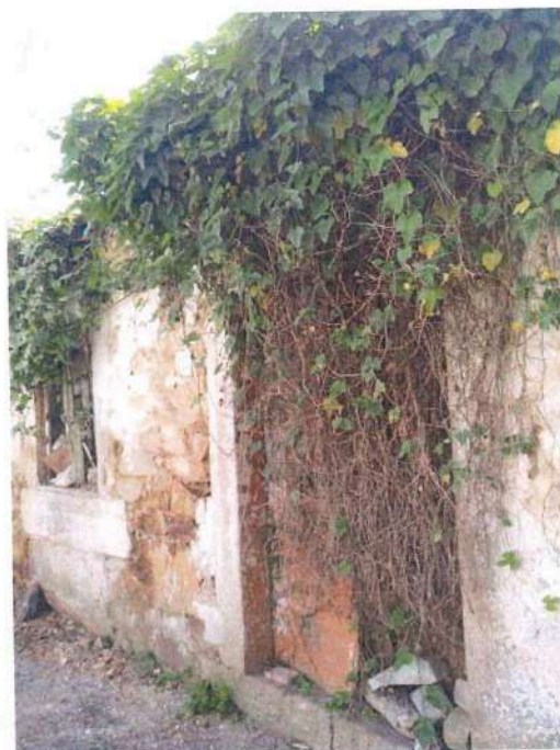
Imagem 4 – Foto onde é visível a fachada da edificação coberta pela vegetação.