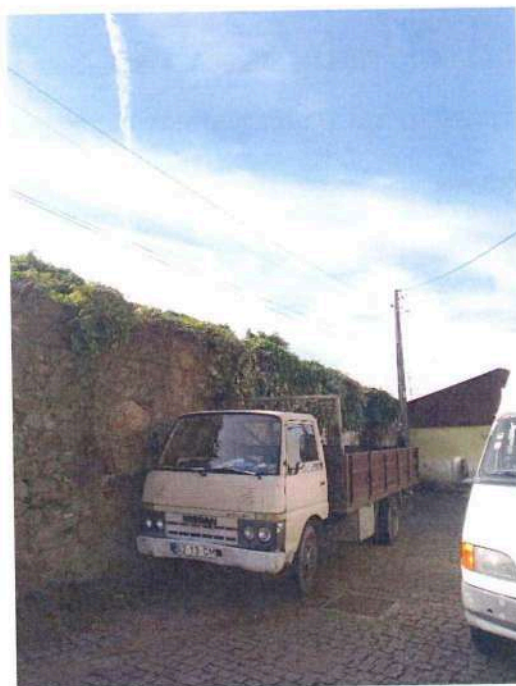
Imagem 2 – Foto onde é visível parte da edificação coberta pela vegetação.